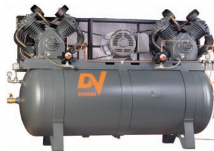
25cv et 30cv - Réservoir d'air comprimé de 240 gal.