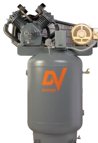
10cv et 15cv - Réservoir d'air comprimé vertical de 120 gal.

“V” DV Systems – Les compresseurs à 4 cylindres sont un design de pompe classique éprouvé par plusieurs décennies d'utilisation de fonctions allant de réparation automobile jusqu'à une production industrielle exigeante. La faible vitesse combinée avec l'excellente réfrigération de ces unités crée un compresseur imparable. Le débit d'air élevée combinée avec l'entretien facile, le design robuste et l'opération efficace font de ces compresseurs une valeur sûre.